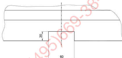
Эскиз А. Задний бампер.

- Сцепной шар ТСУ покрыть слоем консистентной смазки типа ЛИТОЛ.